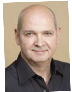
Jan Marijnissen, voorzitter SP

De SP is de derde partij van het land, en de grootste oppositiepartij in de Tweede Kamer. Meer dan anderhalf miljoen mensen steunen onze partij. Dat geeft vertrouwen. We werken dan ook keihard aan een menselijker en socialer Nederland. In de Tweede Kamer én in de steden en dorpen, samen met de mensen. Omdat wij uw steun daarbij hard nodig hebben, vraag ik u om lid te worden! U bent al lid voor 20 euro per jaar. U krijgt dan elke maand ons nieuwsblad De Tribune gratis in de bus.